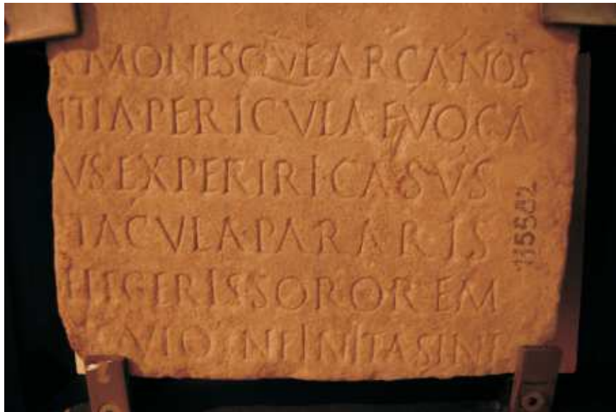
Laudatio Turiae II 0-10. Fragment F odnaleziony w lapidarium Museo Nazionale Romano w Rzymie przez A.E. Gordona w roku 1949. Obecnie eksponat Museo Nazionale Romano w Rzymie