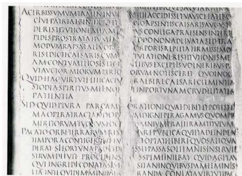
Laudatio Turiae II 11-30. Część fragmentów D i E. Obecnie część kolekcji znajdującej się w Villa Albani w Rzymie (repr. za: Wistrand)