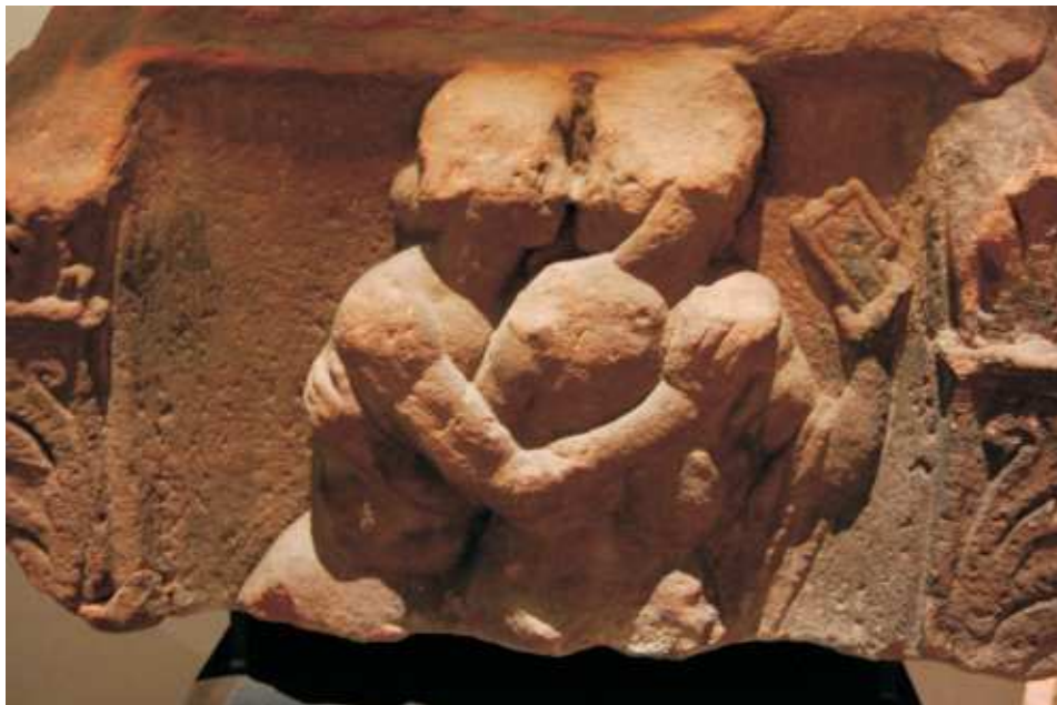
Scena miłosna. Fragment rzymskiego sarkofagu. Obecnie eksponat Musée Archéologique w Strasburgu