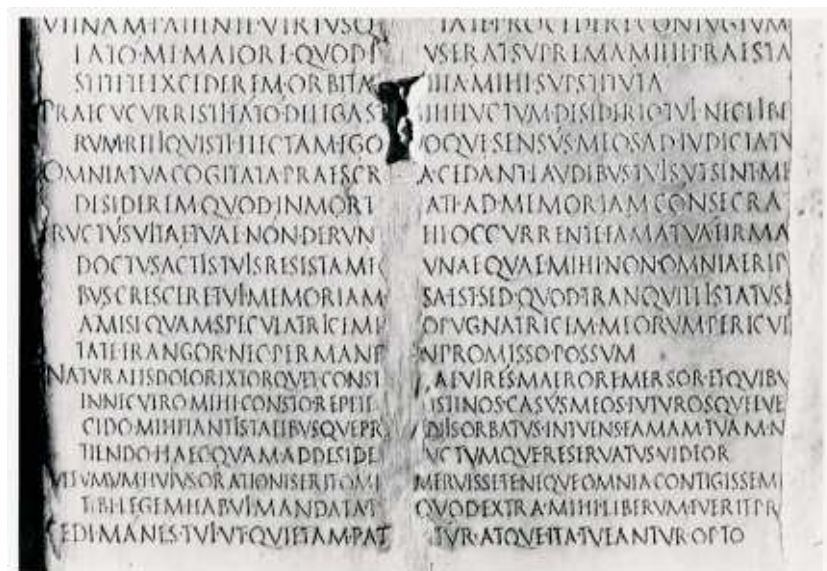
Laudatio Turiae II 51-69. Część fragmentów D i E. Obecnie część kolekcji znajdującej się w Villa Albani w Rzymie