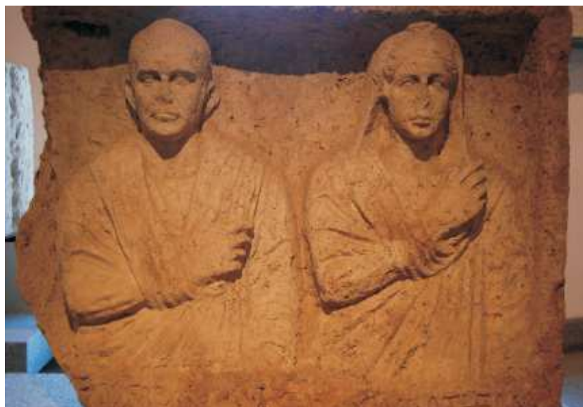
Nagrobny portret małżonków. Obecnie eksponat Museo Nazionale Romano w Rzymie

Rekonstrukcja możliwego wyglądu tablic, na których utrwalono tekst Laudatio Turiae . Treść z fragmentów A, B oraz C znana jest dzięki odpisom. Fragmenty D i E zostały rozkawałkowane i służyły jako przykrywki do katakumbowych loculi . Fragment G odnaleziono w roku 1898 przy Via Portuense, fragment zaś F A.E. Gordon wypatrył w roku 1950 w lapidarium Museo Nazionale Romano (repr. za: Bayer K., Laudatio Turiae , [w:] Exempla Classica. Dialog, Schule & Wissenschaft Klassische Sprachen und Literaturen , t. XXI, red. P. Neukam, München 1987, s. 36)