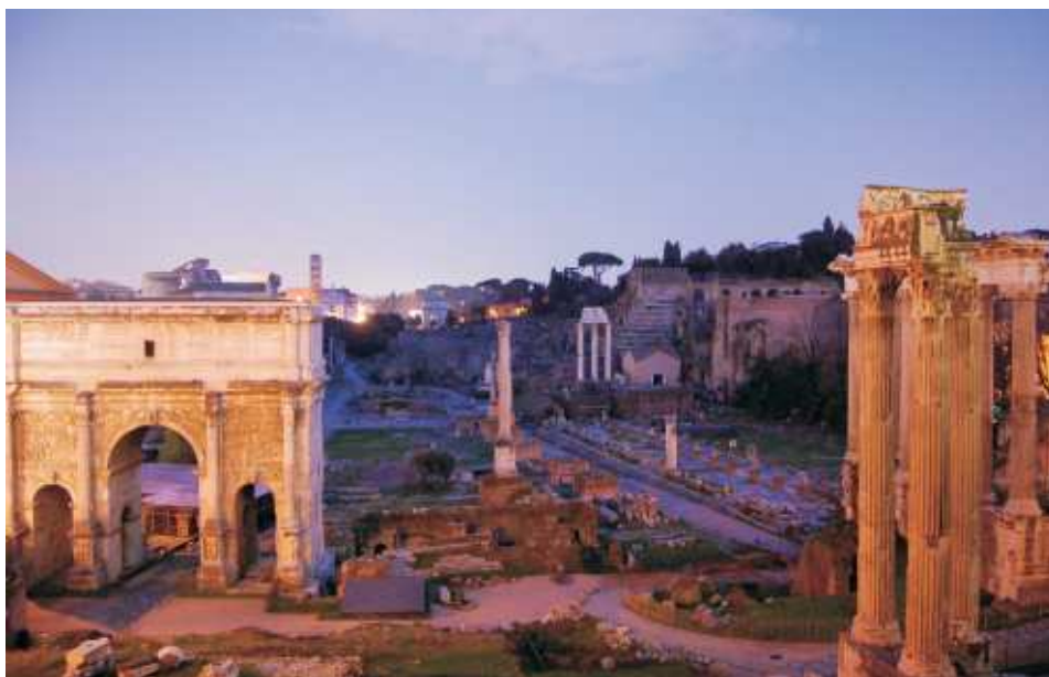
Zmierzch nad Forum Romanum