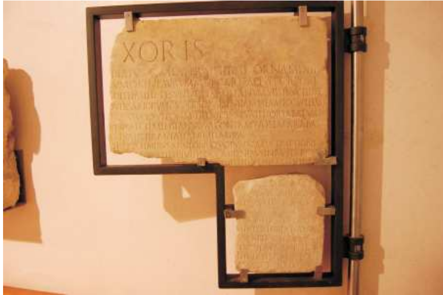
Fragmenty F i G w specjalnej gablocie udostępnione dla zwiedzających Museo Nazionale Romano w Rzymie