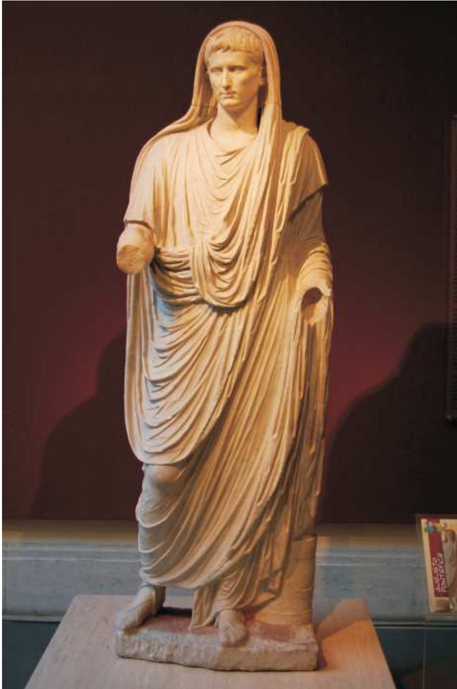
Posąg Oktawiana Augusta przedstawiający cesarza jako najwyższego kapłana. Obecnie eksponat Museo Nazionale Romano w Rzymie