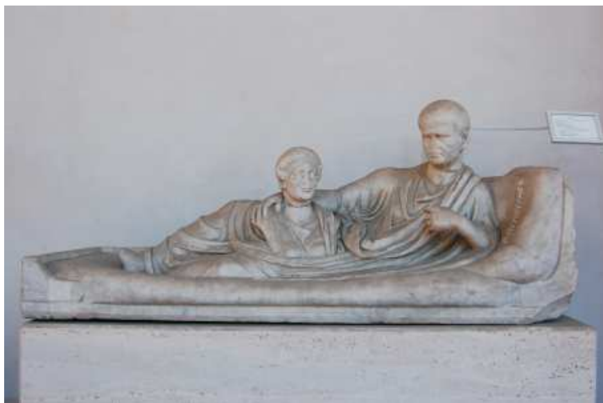
Leżący mężczyzna z popiersiem kobiety, prawdopodobnie żony. 2 połowa I wieku n.e. Obecnie eksponat Museo Nazionale Romano w Rzymie