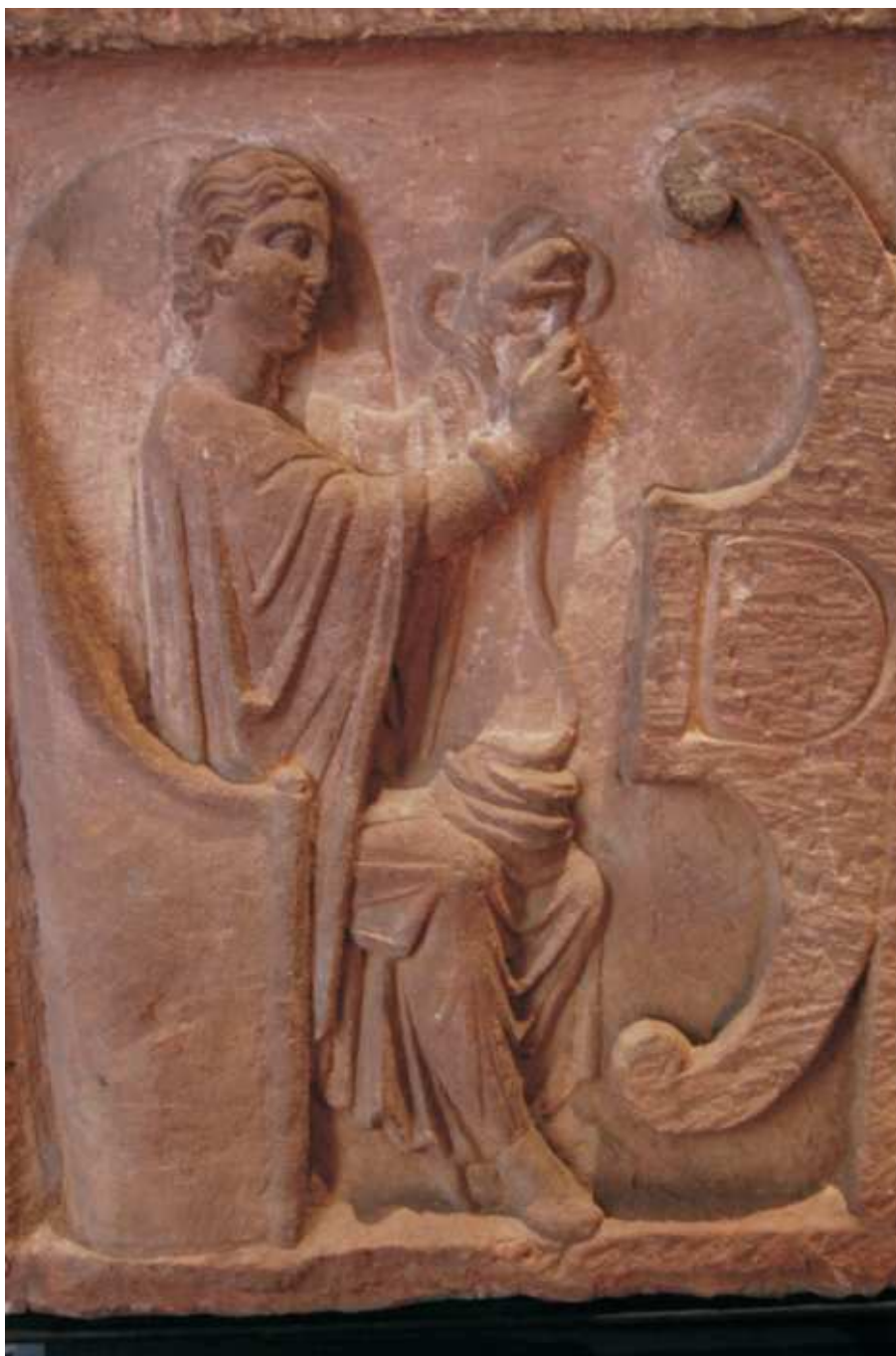
Kobieta przędąca wełnę. Detal z płaskorzeźby nagrobnej. Obecnie eksponat Musée Archéologique w Strasburgu