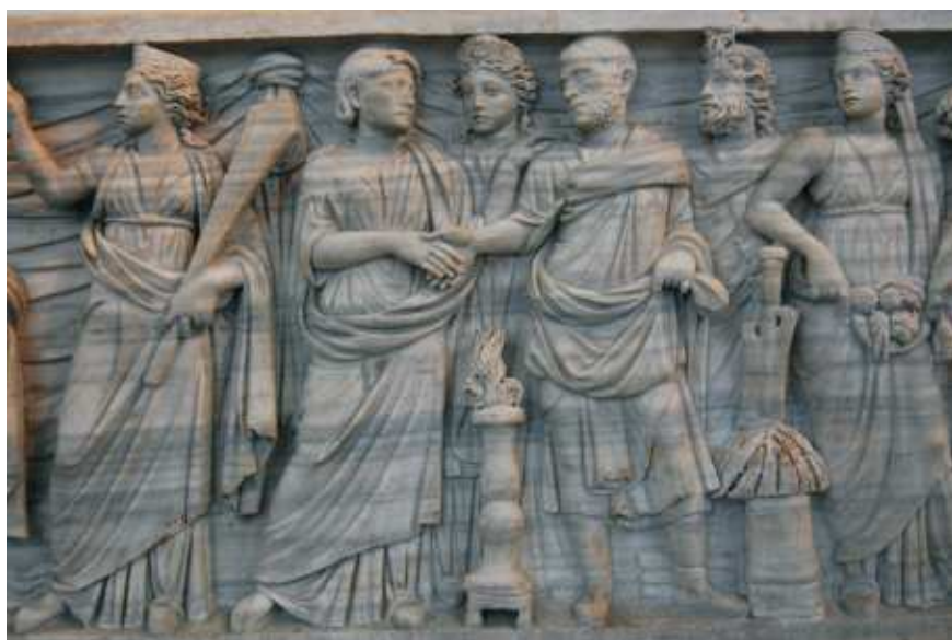
Dextarum iunctio podanie sobie prawych dłoni. Motyw często wykorzystywany na wyobrażeniach przedstawiających zawarcie małżeństwa. Fragment rzymskiego sarkofagu. Obecnie eksponat Museo Nazionale Romano w Rzymie