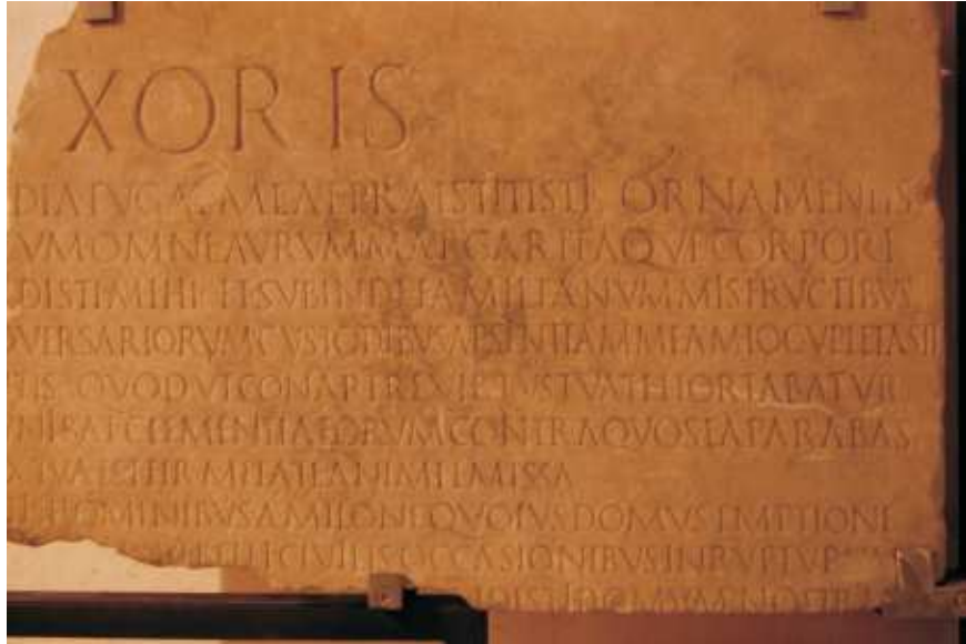
Laudatio Turiae II 1a-11a. Fragment G odnaleziony podczas robót kanalizacyjnych przy Via Portuense w roku 1898. Obecnie eksponat Museo Nazionale Romano w Rzymie