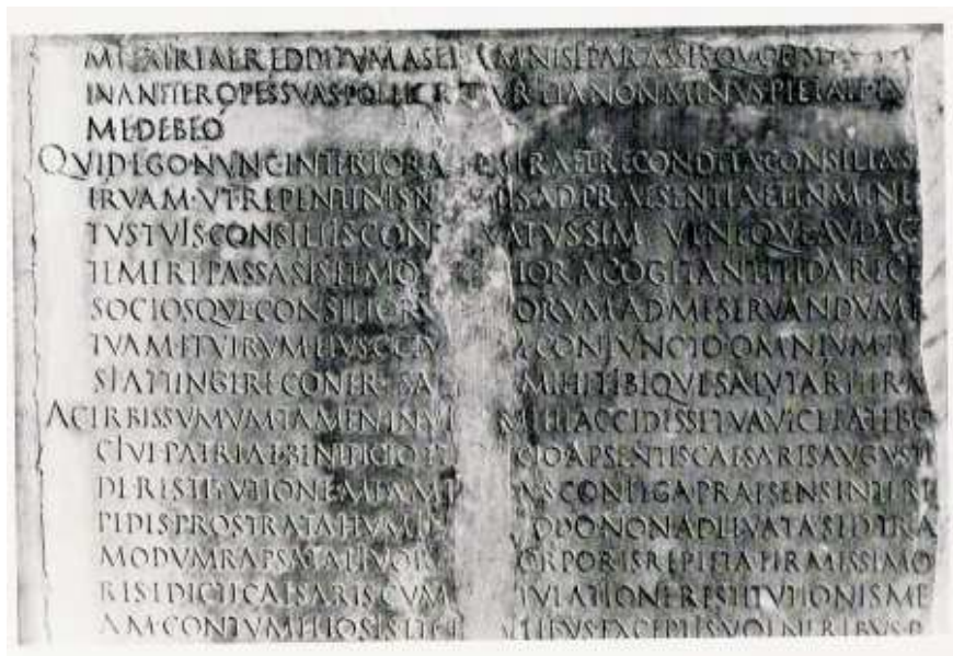
Laudatio Turiae II 1-17. Część fragmentów D i E. Obecnie część kolekcji znajdującej się w Villa Albani w Rzymie (repr. za: E. Wistrand, The so Called Laudatio Turiae. Introduction, Text, Translation, Commentary , Lund 1976; dalej: Wistrand)