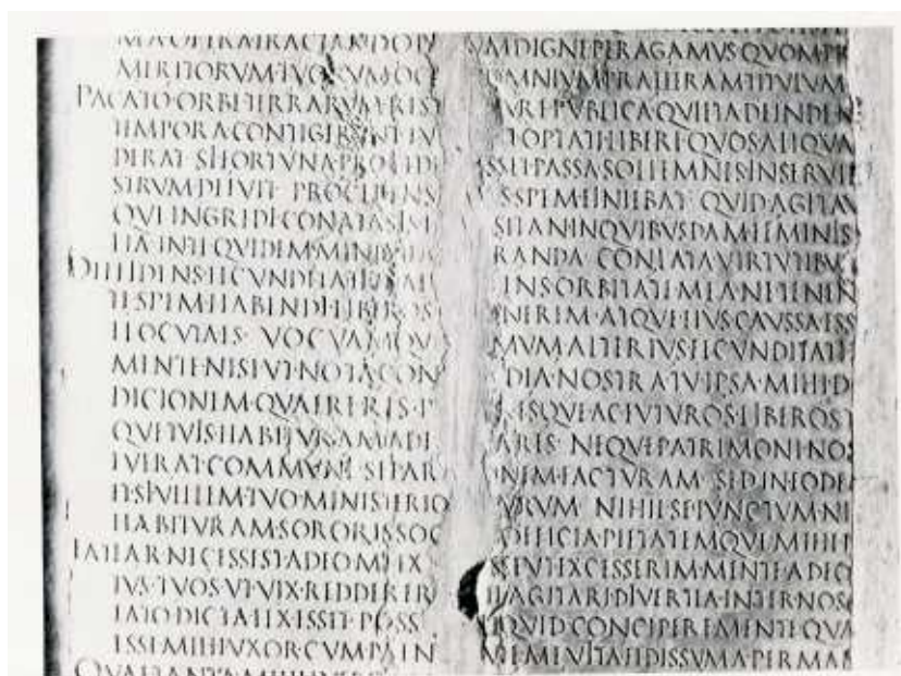
Laudatio Turiae II 24-43. Część fragmentów D i E. Obecnie część kolekcji znajdującej się w Villa Albani w Rzymie (repr. za: Wistrand)